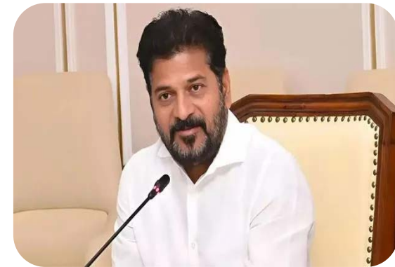
కమిషనర్లకు ముఖ్యమంత్రి దిశా నిర్దేశం చేశారు. క్యూర్ పరిధిలోని సీటీని 12 జోన్లు, 60 - మిగతా5లో