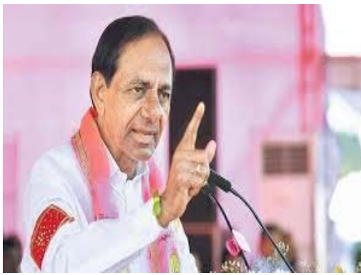
ఉన్నారట కారు పార్కింగ్ లో అందోళన చేసిన కేసీఆర్ సభకు హాజరుపై పూర్తిస్థాయిలో కొరిగి తీరు. నందినగర్ నివాసం నుంచి సార్ ఫాంహౌస్ కు వెళ్లిపోయారు. దీంతో సభకు వస్తారా రాదా అన్నది డౌట్. కానీ సభకు హాజరైతే మాత్రం ఎలాంటి

చెందుతున్నట్లు తెలంగాణ భవన్ వద్ద వచ్చి జరుగుతోంది. కారు పార్కింగ్ లో అందోళనకు సీఎం రేవంత్ రెడ్డి మాట తీరకారణమంటున్నారు. కేసీఆర్ పేరు వింటేనే సీఎం రేవంత్ రెడ్డి ఒంటికాటిపై తీస్తున్నారు. కేసీఆర్ పేరును ప్రస్తావించి మరీ విమర్శలు, ఆరోపణలు చేస్తున్నారు సీఎం. అంశం ఏదైనా కేసీఆర్ పేరును ప్రస్తావించి తీవ్రస్థాయిలో మండిపడుతూ వస్తున్నారని రేవంత్. అయితే సీఎం అడ్డా అడుపు లేకుండా.. కేసీఆర్ ను విమర్శిస్తే ఆయన గౌరవానికి భంగం కలిగే అవకాశం ఉందని బీఆర్ఎస్ నేతలు కంగారు పడుతున్నారు. రేవంత్ కు కొంటర్ ఇచ్చేందుకు మైక్ కట్ చేయకుండా కేసీఆర్ కు మాట్లాడే అవకాశం ఇస్తారా లేదా అన్న డౌట్ కూడా వ్యక్తం చేస్తున్నారు గులాబీ పార్టీ నేతలు. కేసీఆర్ ను అవమానించేందుకు ఆసెంబ్లీకి రావాలని పదే పదే సవాల్ విసుగుతున్నారని, అందుకే బాన్ సభకు వెళ్లే బావుంటుందా.. వెళ్లకపోవడమే మంచిదా అన్న ఊగిసలాటలో