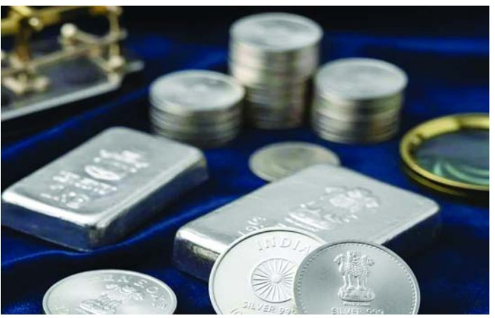
తీసుకునే వారు వెనకడుగు వేయడంతో వెండిలో ఒక్కసారిగా అమ్మకాల ఒత్తిడి పెరగడానికి కారణమని అసలిస్టులు పేర్కొంటున్నారు.

కారణంగా భారీగా దిగి వచ్చింది. రష్యా - ఉక్రెయిన్ మధ్య శాంతి ఒప్పందం విషయంలో కీలక అడుగు పడింది. అమెరికా అధ్యక్షుడు డొనాల్డ్ ట్రంప్తో ఉక్రెయిన్ అధ్యక్షుడు జెలెన్స్కీ భేటీ అయ్యారు. శాంతి ఒప్పందం కుదుర్చుకునేందుకు పుటెన్, జెలెన్స్కీ ఇద్దరూ పూర్తి సుముఖంగా ఉన్నట్లు ట్రంప్ ప్రకటించడం యుద్ధానికి తెరపడుతుందన్న అంచనాల వేళ వెండి ధర పతనమైంది. ప్రపంచంలో అతిపెద్ద డెరివేటివ్ ఎక్స్చేంజీలను నిర్వహిస్తోంది. 2026 మార్చి ఫ్యూచర్ కాంట్రాక్టు సంబంధించిన మార్కెట్ 20వేల డాలర్ల నుంచి 25వేల డాలర్లకు పెంచింది. దీంతో అధిక రిస్క్