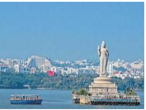
శంషాబాద్ రూరల్ మండలం, చేపల్లె, అమనగల్లు, కేకంపేట, తలకొండపల్లి, మాడ్చల, యాచారం, మంచాల, కందుకూరు, మహేశ్వరం మండలాలను రూరల్ జిల్లాగా ఏర్పాటు చేసేందుకు అధికారులు కసరత్తు మొదలు పెట్టినట్లు తెలుస్తోంది. వచ్చే ఏడాది ఏప్రిల్ నుంచి సెప్టెంబర్ వరకు దేశవ్యాప్తంగా 'హౌస్ హిస్' నిర్వహించాల్సి ఉన్నందున.. జనవరి లోపే ఈ జిల్లాల మార్పుపై డ్రాఫ్ట్ నోటిఫికేషన్ విడుదల చేసేందుకు రెవెన్యూ శాఖ కసరత్తు చేస్తోంది. పోలీస్ స్టేషన్ పరిధి, జిల్లా కలెక్టరేట్ పరిధి ఒకే విధంగా ఉండటం వల్ల సామాన్య ప్రజలకు, శాంతిభద్రతల నిర్వహణకు నులుపు అవుతుందని ప్రభుత్వం భావిస్తోంది.

జిల్లా పరిధిలోకి వస్తాయి. అయితే, అబ్దుల్లాపూర్ మెట్ మండలం జీహెచ్ఎస్సీ పరిధికి బయట ఉండటంతో దీనిపై నిరంకుశం ఇంకా పెండింగ్లో ఉంది. విస్తారమైన భూభాగం, బలీ కారిడార్, పరిశ్రమలతో కూడిన రంగారెడ్డి జిల్లాను రెండుగా విభజించనున్నారు. సైబరాబాద్ పోలీస్ కమిషనరేట్ పరిధిలోని బలీ సంస్థలు, గేబెడ్ కమ్యూనిటీలు ఉండే ప్రాంతం 'అర్బన్ జిల్లా'గా మారుతుంది. కొత్తగా ఏర్పడిన 'పూర్వం నీటి' కమిషనరేట్ పరిధిని రూరల్ జిల్లాగా మార్చనున్నారు. ఇందులో షాద్ నగర్, చేపల్లె, అమనగల్లు, కేకంపేట, తలకొండపల్లి, మాడ్చల, యాచారం, మంచాల, కందుకూరు, మహేశ్వరం వంటి మండలాలు ఉంటాయి. కొత్తగా ఏర్పడిన పూర్వం నీటి కమిషనరేట్ పరిధికి సమానంగా ఒక కొత్త జిల్లాను ఏర్పాటు చేసేందుకు ప్రభుత్వం సిద్ధమైస్తున్నట్లు తెలుస్తోంది. వీటికి సంబంధించిన డ్రాఫ్ట్ నోటిఫికేషన్ కొద్ది రోజుల్లో విడుదల చేయనున్నట్లు సమాచారం. ఇప్పటికే హైదరాబాద్, మల్కాజ్ గిరి జిల్లాల సరిహద్దులను మార్చేందుకు రెవెన్యూశాఖ ఉన్నతాధికారులు వివరాలు సేకరించే పనిలో నిమగ్నమయ్యారు. రంగారెడ్డి జిల్లా పరిధి విస్తృతంగా ఉండడం, జిల్లా పరిధిలో బలీ సంస్థలు, పరిశ్రమలు, గేబెడ్ కమ్యూనిటీలు ఉండడంతో అర్బన్, రూరల్ జిల్లాలుగా విభజించనున్నారు. సైబరాబాద్ పోలీస్ కమిషనరేట్ పరిధి మొత్తాన్ని అర్బన్ జిల్లాగా, పూర్వం నీటి పోలీస్ కమిషనరేట్ పరిధిని రూరల్ జిల్లాగా విభజించనున్నారు. షాద్ నగర్,