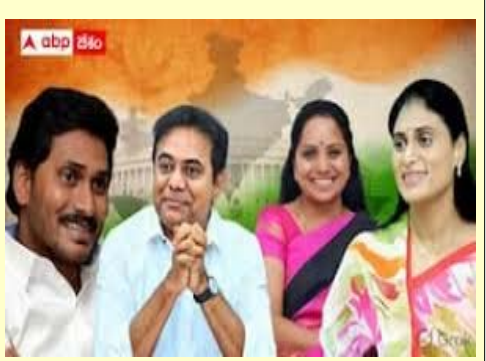
కేసీఆర్-కవిత మధ్య ఆధిపత్య పోరు .. కవిత సొంత పార్టీ దిశగా వెళ్లింది. వైసీపీలో జగన్, షర్మిల మధ్య పోరు కేవలం రాజకీయమైంది మాత్రమే కాదు, కుటుంబ ఆస్తుల పంపకాల్లో తలెత్తిన విభేదాలు కూడా దీనికి ఆజ్యం పోశాయి. తల్లి విజయమ్మ కూడా షర్మిల పక్షాన నిలబడటం పార్టీ కేందర్ లో అయోమయాన్ని సృష్టించింది. అటు బీఆర్ఎస్ లోనూ కేసీఆర్ ముఖ్యమంత్రి అవుతారన్న ప్రచారం జరిగిన -మిగతా5లో

హైదరాబాద్, ఏప్రిల్ 18: రెండు తెలుగు రాష్ట్రాల్లోనూ ప్రాంతీయ రాజకీయాలు ఇప్పుడు ఒకే రకమైన వారసత్వ యుద్ధం చుట్టూ తిరుగుతున్నాయి. ప్రతిపక్షంలో ఉన్నా... అగ్రనేతల కుటుంబాల్లోని అన్నాచెల్లెళ్ల మధ్య తలెత్తిన విభేదాలు పార్టీల ఉనికిని, ఉమ్మడి ఓటు బ్యాంకును ప్రమాదంలోకి నెడుతున్నాయి. ఆంధ్రప్రదేశ్ లో వైఎస్సార్ కాంగ్రెస్, తెలంగాణలో భారత్ రాష్ట్ర సమితి ఎదుర్కొంటున్న ఈ చిత్రమైన పరిస్థితులు ఎదుర్కొంటున్నాయి. ఈ సమస్యను పరిష్కారం చేసుకోవడం వారి పల్ల కావడం లేదు. తెలుగు రాజకీయాల్లో వైఎస్సార్, కేసీఆర్ కుటుంబాలకు ఒక ప్రత్యేక చరిత్ర ఉంది. పార్టీ కష్టకాలంలో ఉన్నప్పుడు అన్నా వెన్నెది నిలిచిన చెల్లెళ్లు, ఇప్పుడు అదే అన్నలకు రాజకీయంగా సవాల్ విసురుతున్నాయి. ఏపీలో వైఎస్ జగన్ జైలులో ఉన్నప్పుడు షర్మిల పాదయాత్ర చేసి పార్టీని కాపాడితే, తెలంగాణలో ఉద్దయ సమయంలో కవిత సాంస్కృతిక సారథిగా నిలిచారు. అయితే, నేడు ఏపీలో జగన్-షర్మిల మధ్య ఆస్తుల గొడవలు, రాజకీయ విభేదాలు బహిరంగమై కోర్టుల వరకు వెళ్లగా... తెలంగాణలో