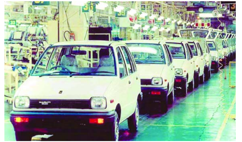
వారాల్లో ఆయా కంపెనీలు వివిధ వాహనాల ధరల్ని పెంచే అవకాశాలు లేకపోలేదని వ్యాఖ్యానించారు. ఇప్పటికే పలు సంస్థలు ఆయా మాడళ్ల రేట్లను పెంచిన సంగతి విదితమే. కాగా, పెరిగే పెట్రోల్, డీజిల్, సిఎన్జీ తదితర ఇంధన ధరలతోనూ వాహనాల అమ్మకాలు పడిపోవచ్చన్న ఆందోళన ఇండస్ట్రీ వర్గాల నుంచి వ్యక్తమవుతున్నది.