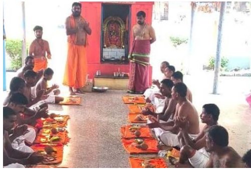
శ్రీరామ జయ రామ జయ జయ రామ” “శ్రీ హనుమ జయ హనుమ జయ జయ హనుమ” నామాలతో మార్చాగింది.