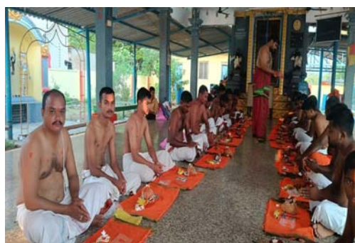
భక్తులు చేసే ప్రతి పనిని రామనామంతో మొదలు పెడితే విజయం తప్పక సిద్ధిస్తుందని అన్నారు. ఆలయ ప్రాంగణం “