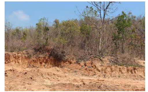
పొంది ఉందని, వన్యప్రాణులకు తీవ్రమైన ప్రాణమున్ను కలిగిస్తున్నాయని పర్యావరణ మిగతా2లో