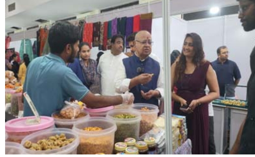
మరియు యూట్యూబ్ ఇన్ఫ్లూయెన్సర్లు పాల్గొన్నారు. ఎగ్జిబిషన్లో స్టాల్స్ ఏర్పాటు చేసిన వ్యాపారులు మాట్లాడుతూ, కార్యక్రమం చాలా సమర్థవంతంగా నిర్వహించారని, భవిష్యత్తులో కూడా ఆర్విఎస్ ఎగ్జిబిషన్ను మరింత విస్తృత స్థాయిలో నిర్వహించాలని ఆకాంక్షించారు.