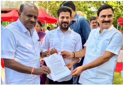
అనుకూలతల వలన దేశ పారిశ్రామిక ఉత్పత్తి లక్ష్యాలకు హైదరాబాద్ కేంద్రంగా నిలవగలదని వివరించారు. హైదరాబాద్ లో హైడ్రోజన్ టెక్నాలజీతో గ్రీన్ స్టీల్ క్లస్టర్, ఆటో, రక్షణ రంగాలకు అవసరమైన ఉత్పత్తుల తయారీ

న్యూఢిల్లీ:బయ్యారంలో గ్రీన్ ఫీల్డ్ ఫ్లాంట్ (ఉక్కు పరిశ్రమ) ఏర్పాటు చేయాలని కేంద్ర ఉక్కు, భారీ పరిశ్రమల శాఖ మంత్రి హెచ్ డి కుమారస్వామి కి ముఖ్యమంత్రి రేవంత్ రెడ్డి విజ్ఞప్తి చేశారు. గ్రీన్ ఫీల్డ్ ఫ్లాంట్ ఏర్పాటుతో ఉక్కు కొరత తగ్గడంతో పాటు పర్యావరణానికి మేలు కలుగుతుందని తెలిపారు. కేంద్ర మంత్రి కుమారస్వామి, ఉక్కు శాఖ సహాయ మంత్రి భూపతిరాజు శ్రీనివాస్ వర్మ తో ముఖ్యమంత్రి ఢిల్లీలో సమావేశమయ్యారు. ఈ సందర్భంగా తెలంగాణ రైజింగ్ 2047 విజన్లో భాగంగా రూపొందించిన పారిశ్రామిక ప్రతిపాదనలను కేంద్ర మంత్రులకు వివరించారు. తెలంగాణలో పాత వాహనాల ప్రాప్తి ఉక్కును రీసైక్లింగ్ చేసే పరిశ్రమ ఏర్పాటు చేయాలని కేంద్ర మంత్రులను కోరుతూ ఈ సందర్భంగా వినతిపత్రం అందించారు. అందుబాటులో ఉన్న సాంకేతికత, భారీ పరిశ్రమలు, పారిశ్రామిక ఉత్పత్తికి ఉన్న