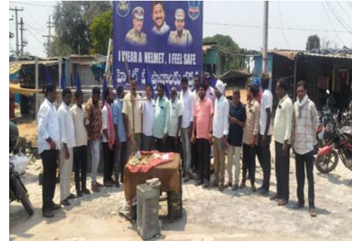
సెంటర్ మరియు ఎలక్ట్రానిక్ మీడియా ప్రతినిధులు పాల్గొని సహకరించాలని విజ్ఞప్తి చేశారు. గూడూరు మండలంలోని అన్ని గ్రామాల నుంచి యువకులు, విద్యావంతులు, ప్రజలు భారీ సంఖ్యలో తరలివచ్చి ఈ కార్యక్రమాన్ని విజయవంతం చేయాలని పిలుపునిచ్చారు. అనంతరం అంబేద్కర్ విగ్రహానికి పూలమాలల నివాళులర్పించారు. అనంతరం యువజన జేపీసీ స్టీరింగ్ కమిటీని ఎన్నుకున్నారు. ముఖ్య సలహాదారులు..