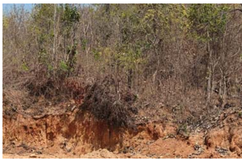
విమర్శిస్తున్నారు. అక్రమంగా మట్టి దోపిడీకే పరిమితం కాకుండా మట్టి దండా పల్ల పర్యావరణానికి ప్రమాదం

నిఘా టీం, అక్షర సవాల్ :వరంగల్ జిల్లా ఖానాపూర్ మండలం బుధరాపుపేట శివారు టేకుల తండా సమీపంలోని పోచారం అటవీ ప్రాంతంలో అక్రమంగా మట్టి తవ్వకాలు చేపట్టి కొందరు అక్రమార్కులు మట్టి దండా ను సాగిస్తున్నారు. అధికారుల అందడందలతో కొందరు మట్టి వ్యాపారం మూడు పువ్వులు ఆరు కాయలుగా తమ మట్టి దండాను సాగిస్తున్నట్లుగా సర్వేత్రా ఆరోపణలు వినిపిస్తున్నాయి. అటవీ ప్రాంతంలో యంత్రాల సహాయంతో రాత్రి వేళల్లో ఇష్టానుసారంగా మట్టి తవ్వకాలు జరుగుతున్నప్పటికీ సంబంధిత అధికారులు చూసి చూడనట్లుగా వ్యవహరిస్తున్నారని పలువురు