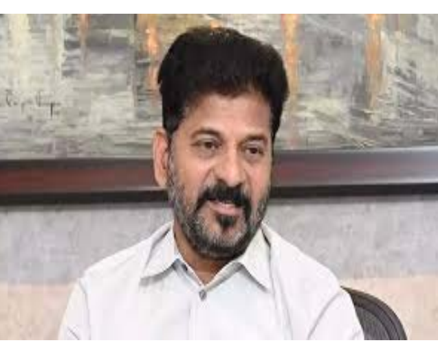
నియంత్రించిన దక్షిణాది రాష్ట్రాలకు సీట్లు తగ్గుతాయన్న ఆందోళనలో రేవంత్ రెడ్డి ఒక 'హైట్రెడ్' మోడల్ ను మిగతా5లో

హైదరాబాద్, ఏప్రిల్ 18: ఒకప్పుడు కాంగ్రెస్ అంటే ఢిల్లీ నుండి వచ్చే ఆదేశాల కోసం రాష్ట్ర నేతలు వేచి చూసే పరిస్థితి ఉండేది. కానీ ఇప్పుడు సీన్ రివర్స్ అయ్యింది. తెలంగాణ ముఖ్యమంత్రి రేవంత్ రెడ్డి ఇచ్చే సలహాలు, ఆయన రూపొందించే వ్యూహాలు ఇప్పుడు అఖిల భారత కాంగ్రెస్ కమిటీ కి దిక్పాదిగా మారుతున్నాయి. కేవలం ఒక రాష్ట్ర ముఖ్యమంత్రిగా మాత్రమే కాకుండా, రాహుల్ గాంధీ, మల్లికార్జున్ ఖర్గే వంటి అగ్రనేతలకు సమ్యక్మైన 'నేషనల్ స్ట్రాటజిస్ట్'గా రేవంత్ రెడ్డి ఎదిగిన తీరు ఇప్పుడు జాతీయ రాజకీయాల్లో ఆసక్తికర చర్చకు దారితీసింది. రాజకీయాల్లో ప్రత్యర్థి వేసే ఎత్తుగడలకు ప్రతిస్పందించడం ఒక ఎత్తు అయితే, ప్రత్యర్థిని తన దారిలోకి తెచ్చుకోవడం మరో ఎత్తు. రేవంత్ రెడ్డి సరిగ్గా ఇదే చేస్తున్నారు. గత పార్లమెంట్ ఎన్నికల సమయంలో 'బీజేపీ గెలిస్తే రాజ్యాంగాన్ని మారుస్తుంది' అనే నినాదాన్ని ఆయన క్షేత్రస్థాయిలోకి బలంగా తీసుకెళ్లారు. ఈ ఒక్క వ్యూహం దేశవ్యాప్తంగా బీజేపీని అత్యర్థుణ్ణి పడేసింది. రాజ్యాంగ రక్షణ, సామాజిక న్యాయం వంటి అంశాలను కాంగ్రెస్ ప్రధాన ఎజెండాగా మార్చడంలో రేవంత్ రెడ్డి కీలక పాత్ర పోషించారు. కేవలం విమర్శలకే పరిమితం కాకుండా, దూకుడుతో కూడిన ఎజెండాను సెట్ చేయడంలో ఆయన సఫలీకృతులయ్యారు. నియోజకవర్గాల పునర్విభజన అంశం ప్రస్తుతం ఉత్పాది -- దక్షిణాది రాష్ట్రాల మధ్య చిచ్చు పెడుతోంది. జనాభా