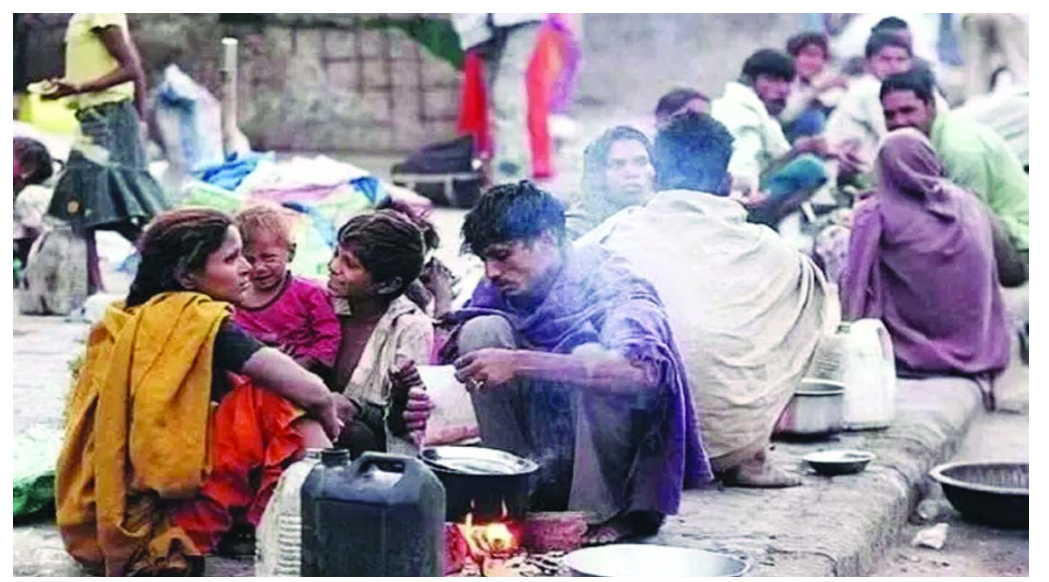
అంచనా వేస్తోంది. మరోవైపు, ఈ యుద్ధ ప్రభావం వల్ల ప్రపంచవ్యాప్తంగా కూడా 88 లక్షల మంది ప్రజలు పేదరికంలోకి జారిపోయే ప్రమాదంలో ఉన్నారు. పశ్చిమాసియా ఉద్రిక్తతల వల్ల ఆసియా-పసిఫిక్కు 299 బిలియన్ డాలర్ల(మన కరెన్సీలో రూ. 27.82 లక్షల కోట్ల) వరకు నష్టం వాటిల్లవచ్చు. చైనాలో పేదరికంలోకి జారిపోయే ప్రమాదంలో ఉన్న వారి సంఖ్య సుమారు 1,15,000 నుంచి 6,20,000కు పైగా పెరుగుతుందని నివేదిక అంచనా వేసింది.

పశ్చిమాసియాలో కొనసాగుతున్న ఉద్రిక్తతలు భారత్పై మరొక ప్రభావం చూపనున్నాయి. ఈ పరిణామాల వల్ల మనదేశంలో 25 లక్షల మంది ప్రజలు పేదరికంలోకి జారిపోయే ప్రమాదం ఉందని, అలాగే మానవ అభివృద్ధి పురోగతిలో దేశం కొంత నష్టాన్ని చూడక తప్పదని ఐక్యరాజ్యసమితి అంచనాలు వెల్లడిస్తున్నాయి. 'మధ్యప్రాచ్యం లో సైనిక ఉద్రిక్తతలు: ఆసియా, పసిఫిక్ ప్రాంతం మానవ అభివృద్ధిపై ప్రభావాలు' అనే శీర్షికతో ఐక్యరాజ్యసమితి డెవలప్మెంట్ ప్రోగ్రామ్ (యూఎన్డీపీ) విడుదల చేసిన నివేదికలో.. ఈ యుద్ధం అధిక ఇంధనం, రవాణా, ముడిసరుకుల ఖర్చుల ద్వారా ఆసియా, పసిఫిక్ ప్రాంతమంతటా మానవాభివృద్ధిపై ఒత్తిళ్లను పెంచుతోంది. ఇది దేశంలోని ప్రజల కొనుగోలు శక్తిని, ఆహార భద్రతను తగ్గిస్తోంది. ప్రభుత్వ బడ్జెట్పై భారం మోపడమే కాకుండా, జీవనోపాధిని బలహీనపరుస్తోందని నివేదిక హెచ్చరించింది. ఇరాన్ యుద్ధ పరిస్థితుల తర్వాత దేశంలో పేదరికం రేటు 23.9 శాతం నుంచి 24.2 శాతానికి పెరుగుతుందని, దీనివల్ల 24,64,698 మంది ప్రజలు పేదరికంలోకి వెళ్లారని నివేదిక తెలిపింది. సంక్షోభానికి ముందు 35,15,69,000 మంది పేదరికంలో ఉండగా, సంక్షోభం తర్వాత దేశంలో ఈ సంఖ్య సుమారుగా 35,40,33,698కి చేరుతుందని నివేదిక