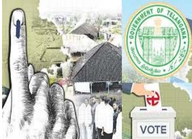
ఈ లిస్టులను జిల్లా పంచాయతీ అధికారి కన్ఫిమ్ చేసిన తర్వాత.. సెంటర్ ఫర్ గుడ్ గవర్నెన్స్ యూజర్ మాన్యువల్ నూచనల - మిగతా5లో

హైదరాబాద్, ఏప్రిల్ 20: తెలంగాణలో ఎంపీటీసీ, జడ్పీటీసీ ఎన్నికల సగం మోగడానికి సమయం ఆసన్నమైంది. గత కొంతకాలంగా ప్రత్యేకాధికారుల పాలనలో ఉన్న మండల, జిల్లా పరిషత్లకు తిరిగి ప్రజాప్రతినిధులను ఎన్నుకునేందుకు రాష్ట్ర ఎన్నికల సంఘం వేగంగా అడుగులు వేస్తోంది. పరిస్థితులు అనుకూలమై మే నెలలోనే ఎన్నికలు నిర్వహించేలా ప్రణాళికలు సిద్ధమవుతున్నాయి. ఎన్నికల నిర్వహణలో అత్యంత కీలకమైన ఓటర్ జాబితా తయారీకి ఎన్ఈసీ అధికారులు జారీ చేసింది. కొత్త ఓటర్ చేరిక: 10.07.2025 నుండి 05.02.2026 వరకు కేంద్ర ఎన్నికల సంఘం నవీకరించిన జాబితా ఆధారంగా అదనపు ఓటర్లను గుర్తించనున్నారు. గడువు: ఓటర్ డేటాలో ఏవైనా వ్యత్యాసాలు ఉంటే ఈ నెల 23వ తేదీలోపు నివేదించాలని హైదరాబాద్, మేడ్చల్ మినో మిగిలిన అన్ని జిల్లాల కలెక్టర్లను ఆదేశించారు. తుది జాబితా: ముసాయిదా జాబితాపై అభ్యంతరాలు స్వీకరించిన తర్వాత తుది జాబితాను విడుదల చేసి, పోలింగ్ కేంద్రాలను ఖరారు చేస్తారు. అదనపు ఓటర్ వివరాలను మండలాల వారీగా గుర్తించి, వాటిని సంబంధిత పంచాయతీ, పోలింగ్ కేంద్రాల వారీగా ఉన్న జాబితాలకు జత చేయాలి. ఈ మేరకు అధికారులకు ఆదేశాలు వెళ్ళాయి. వీటి ఆధారంగానే ఎంపీటీసీ, జడ్పీటీసీల పరిధిలోని గ్రామపంచాయతీలు, పోలింగ్ స్టేషన్ల వారీగా కొత్త జాబితాలు రూపొందిస్తారు.