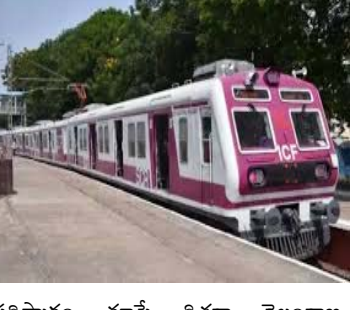
వరిష్కారం చూపే దిశగా తెలంగాణ ప్రభుత్వం అడుగులు వేస్తోంది. ఇందులో

హైదరాబాద్, ఏప్రిల్ 20: హైదరాబాద్ సిటీలో రోజురోజుకూ ట్రాఫిక్ డిమాండ్ రీతిలో పెరుగుతోంది. దాంతో హైదరాబాద్లో ట్రాఫిక్ కష్టాలకు చెక్ పెట్టేందుకు తెలంగాణ ప్రభుత్వం ఎంఎంటీఎస్ రైల్వేలో అందరికీ ఉచిత ప్రయాణం కల్పించాలని సంచలన నిర్ణయం తీసుకుంది. దీనికి సంబంధించిన పూర్తి వివరాలు కూడా ఉన్నాయి. హైదరాబాద్ సిటీలో నిరంతరం పెరుగుతున్న ట్రాఫిక్ రద్దీ, వాయు కాలుష్య సమస్యలకు శాశ్వత