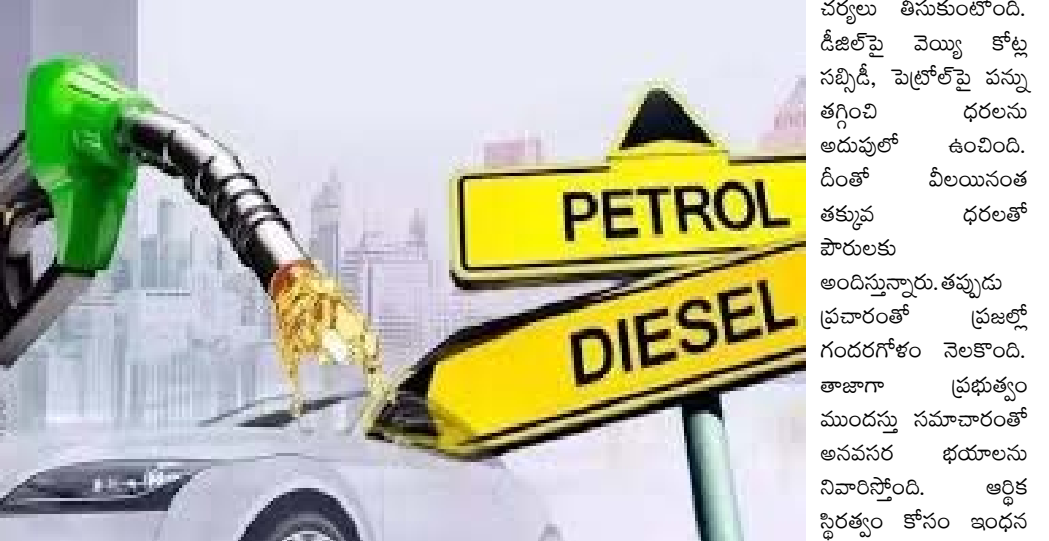
వ్యవసాయం, చిన్న వ్యాపారాలకు మేలు చేస్తోంది. ప్రపంచవ్యాప్తంగా ఇంధన ధరలు 20--30 శాతం పెరిగిన సమయంలో భారత్ ప్రభుత్వం పౌరభివృద్ధి దృష్ట్యా

ముంబై, ఏప్రిల్ 24: పశ్చిమాసియా యుద్ధం కారణంగా దేశంలో చమురు కొరత నెలకొంది. ఇప్పటికే ఎల్బీజీ ధరను కేంద్రం పెంచింది. యుద్ధం ముగిసే సూచనలు కనిపించడం లేదు. సీజ్ ఫైర్ కుదిరినా శాశ్వత శాంతి ప్రయత్నాలు ఫలించడం లేదు. మరోవైపు హరూజ్ లో ఇప్పుడు అమెరికా పట్టు సాధించింది. ఈ నేపథ్యంలో చమురు ధరలు పెరుగుతాయని ప్రచారం జరుగుతోంది. ఈ క్రమంలో కేంద్ర పెట్రోలియం శాఖ అధికారులు పెట్రోల్, డీజిల్ ధరల పెంపు గురించి వ్యాప్తమైన ఆందోళనలను తొలగించారు. ప్రభుత్వ స్థాయిలో అలాంటి ప్రతిపాదనలు లేవని ప్రకటించింది. సోషల్ మీడియాలో పెట్రోల్ ధరలు రూ.5 నుంచి 10 వరకు ధరలు పెరుగుతాయనే తప్పుడు సమాచారం వ్యాప్తి చెందింది. ఈ వార్తలు వాహనదారులు, వ్యాపారుల్లో టెన్షన్ కు కారణమయ్యాయి. కేంద్రం ట్యూటర్ ద్వారా తక్షణ స్పందించి, ఇలాంటి ప్రణాళికలు లేనట్టి వాస్తవాన్ని ప్రకటించింది. 40 ఏళ్లుగా ఇంధన ధరల్లో మార్పు లేకుండా ఉన్న ఏకైక దేశం భారత్. అంతర్జాతీయ క్రూడ్ అయిల్ ధరలు 70--80 డాలర్ల మధ్య ఉపండుకున్నా ప్రభుత్వం పోషక విధానాలతో పౌర భారాన్ని తగ్గించింది. ఈ స్థిరత్వం వాహన రవాణా,