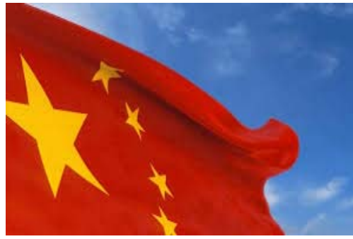
పూర్వయితే, 365 రోజులు వాహనాలు, భారీ ఆయుధాలు తరలింపునకు వీలవుతుంది. ప్రస్తుతం 29 కి.మీ./గం వేగం 70 కి.మీ./గం అవుతుంది. దూరం, ఖర్చు గణనీయంగా తగ్గుతాయి. 2018 నుంచి చైనా లద్దాక్ భూభాగాలను

న్యూఢిల్లీ, ఏప్రిల్ 24: ప్రపంచ దృష్టి పశ్చిమాసియా యుద్ధం, శాంతి చర్చలపై ఉంది. దేశ ప్రజల దృష్టి ఐదు రాష్ట్రాల ఎన్నికలు, వాటి ఫలితాలపై ఉంది. ఈ సమయంలో కేంద్రం దేశ సరిహద్దులో మొదలు పెట్టిన ఓ పనిని పూర్తిచేసే దిశగా చర్యలు చేపట్టింది. లద్దాక్ లో కీలక టన్నెల్ పనులను దాదాపు ముగించబోతోంది. బాల్చ్ నుంచి మిమానాపూర్ వరకు 13 కిలోమీటర్ల పొడవైన జోజులా పర్వతాన్ని తవ్వతూ, రోజుకు 4 మీటర్ల వేగంతో పనులు జరుగుతున్నాయి. మే 30 నాటికి మిగిలిన 300 మీటర్లు పూర్తి చేయబోతున్నారు. దీనికి న్యూ ఆస్ట్రేలియన్ టన్నెలింగ్ పద్ధతి వాడుతున్నారు. అక్టోబర్ నుంచి ఏప్రిల్ వరకు జోజులా పాస్ మంచుతో కప్పిపోతూ, శ్రీనగర్-లద్దాక్ మార్గం మూసుకుపోతుంది. స్థానికులు ఆవహారం, మందులు నిల్వ చేసుకుంటారు; సైన్యం ఇంటర్-కంటినెంట్ షాన్లతో స్వయం సమృద్ధిగా ఉంటుంది. ఈ టన్నెల్