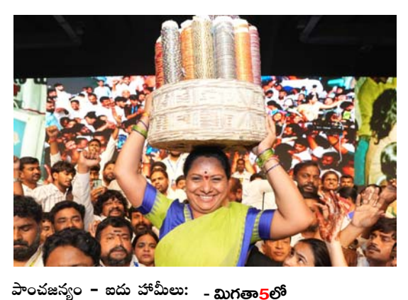
పాంచజన్యం - ఐదు హామీలు: - మిగతా5లో