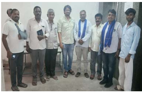
జరుగుతున్నాయని, పైగా పని దినాలు పెంచుతున్నట్లు ప్రకటించినా తగిన నిధులు కేటాయించకుండా రాష్ట్రాలపై భారం మోపుతున్నారని విమర్శించారు. స్థానిక సంస్థలైన గ్రామపంచాయతీలు, మండల పరిషత్, జిల్లా పరిషత్ల