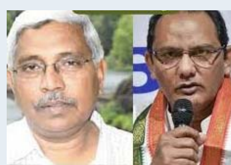
ఉండటంతో తాజా నిర్ణయంతో ఆయన మంత్రిగా కొనసాగడం స్పష్టమైంది. స్వయంగా కలిసిన ముఖ్యమంత్రి రేవంత్ రెడ్డి..

హైదరాబాద్, ఏప్రిల్ 25: తెలంగాణ గవర్నర్ శివప్రతాప్ శుక్లా కీలక నిర్ణయం తీసుకున్నారు. గవర్నర్ కోటలో ఇద్దరు ఎమ్మెల్యేల నియామకానికి గ్రీన్ సిగ్నల్ ఇచ్చారు. మాజీ టీఎంపీయూ క్రికెట్ అజార్, ఎం. కోదండరాం ఎమ్మెల్యేల అభ్యర్థిత్వాలకు గవర్నర్ ఆమోదం తెలిపారు. దీంతో అజార్, కోదండరాం ఇద్దరూ మండలికి వెళ్లడం ఖరారైంది. గత ఏడాది ఆగస్ట్ 30న ఈ ఇద్దరిని ఎమ్మెల్యేలుగా నియమించాలని తెలంగాణ కేబినెట్ తీర్మానం చేసి గవర్నర్ కు పంపింది. అయితే అప్పటి నుంచి ఈ పైల్ పెండింగ్ లోనే ఉంది. ఇప్పుడు గవర్నర్ గ్రీన్ సిగ్నల్ ఇవ్వడంతో పరిస్థితి మారింది. ముఖ్యంగా అజార్, కోదండరామ్ మంత్రి పదవి.. ఆయన ఎమ్మెల్యే అభ్యర్థిత్వంపైనే ఆధారపడి