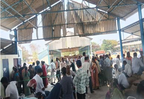
నాణ్యత దెబ్బతింటుందని రైతులు ఆందోళన వ్యక్తం చేస్తున్నారు. తక్షణమే ఆధార్ తంబ్ ప్రక్రియను వేగవంతం చేయాలని, అదనపు నిబంధనలు నియమించాలని, కొనుగోలు

గీసుగొండ, ఏప్రిల్ 25 అక్షర సవాల్: వరంగల్ ఏనుమామల మార్కెట్లో రైతుల సమస్యలు మళ్లీ ముదిరాయి. మొక్కజొన్న కోసుగోళ్ల కోసం వచ్చిన రైతులు ఆధార్ తంబ్ నమోదు కోసం గంటల తరబడి క్యాలలో నిలబడుతూ తీవ్ర ఇబ్బందులు పడుతున్నారు. సరైన వసతులు లేక ఎండలోనే నిలబడాల్సి రావడంతో రైతుల ఆవేదన వ్యక్తమవుతోంది. మార్కెట్ యార్డులో తాగునీరు, నీడ వంటి ప్రాథమిక సదుపాయాలు లేకపోవడంతో రైతులు విసుగు చెంది నేలపై పడుకుని విక్రాంతి తీసుకుంటున్నారు. గంటల తరబడి ఎదురుచూసినా పనులు పూర్తి కాకపోవడంతో రైతుల్లో నిరాశ నెలకొంది. ఇంకా కొనుగోలు చేసిన మొక్కజొన్నను గోదాలకు తరలించడంలో కూడా ఆలస్యం జరుగుతుండటంతో రైతులకు మరింత ఇబ్బందులు తలెత్తుతున్నాయి. నియల్ ఆలస్యం కారణంగా ధాన్యం