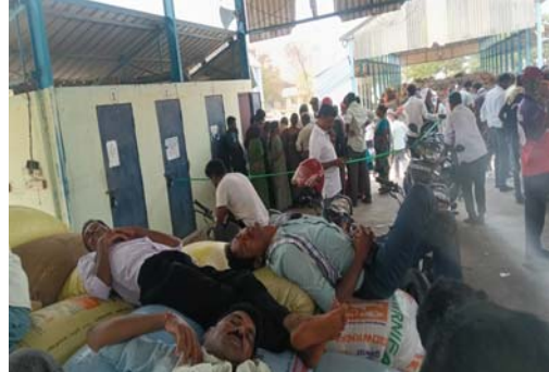
చేసిన ధాన్యాన్ని వెంటనే గోదాలకు తరలించేలా చర్యలు తీసుకోవాలని రైతులు అధికారులను కోరుతున్నారు.