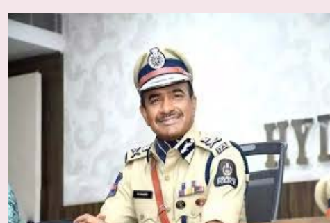
ఆనంద్ ను తదుపరి డీజీపీగా నియమించేందుకు ప్రభుత్వం దాదాపు నిర్ణయం తీసుకున్నట్లు సమాచారం. ప్రస్తుతం రాష్ట్ర

హైదరాబాద్, ఏప్రిల్ 25: తెలంగాణకు కొత్త పోలీస్ బాస్ రానున్నారు. తదుపరి డీజీపీగా 1991 బ్యాచ్ ఐపీఎస్ అధికారి సీవీ ఆనంద్ నియమితులయ్యే అవకాశాలు ఉన్నట్లు తెలుస్తోంది. ప్రస్తుత డీజీపీ శివధర్మర్షి ఈ నెల 30న పదవీ విరమణ చేయనుండటంతో.. యూపీఎస్సీ పంపిన ముగ్గురు సీనియర్ జూబిలీలో అత్యంత సీనియర్ అయిన ఆనంద్ వైపు ప్రభుత్వం మొగ్గు చూపుతున్నట్లు సమాచారం. హోంశాఖలో ఇటీవల జరిగిన ఐపీఎస్ బదిలీలు కూడా ఈ మార్పును ధృవీకరిస్తున్నాయి. ఈ నెలఖారులోగా దీనిపై అధికారిక ఉత్తర్వులు వెలువడే అవకాశం ఉంది. తెలంగాణకు కొత్త డీజీపీ రానున్నారు. సీనియర్ ఐపీఎస్ అధికారి, 1991 బ్యాచ్ కు చెందిన సీవీ