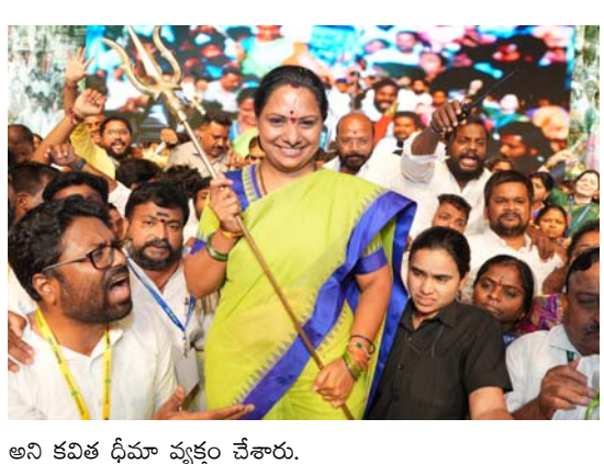
అని కవిత ధీమా వ్యక్తం చేశారు.