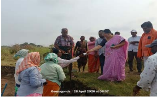
రోజుకు రూ.307 వేతనం పొందాలని సూచించారు. ఎన్ఎంఎంఎస్ అటెండెన్స్లో రెండు ఫోటోలు తప్పనిసరిగా నమోదు చేయాలని స్పష్టం చేశారు. ప్రతి 40 మంది వేతనదారులకు ఒక వర్కింగ్ మేట్ను నియమించుకోవడం ద్వారా హాజరు నమోదు, పనుల నిర్వహణ సులభతరం అవుతుందని వివరించారు. పనులు జరుగుతున్న ప్రదేశాల్లో నీడ, తాగునీరు, ప్రథమ చికిత్స సదుపాయాలు తప్పనిసరిగా