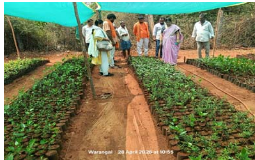
కల్పించాలని గ్రామ పంచాయతీలకు ఆదేశించారు. నర్సరీల అభివృద్ధిపై ప్రత్యేక దృష్టి సారినూ, పూలు, పండ్లు, ఔషధ మొక్కలతో పాటు నీడనిచ్చే మొక్కలను రహదారుల ఇరువైపులా విస్తృతంగా నాటాలని సూచించారు. ఈ కార్యక్రమంలో వివిధ గ్రామాల నర్సరీలు, అధికారులు, ప్లీట్ అసిస్టెంట్లు పాల్గొన్నారు.