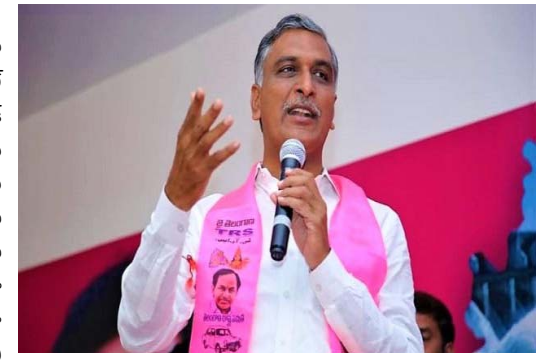
వేధిస్తోందని ధ్వజమెత్తారు. బెయిల్ వచ్చే సమయంలో పీటీ వారెంటు తెచ్చి మరీ జైల్లో ఉంచుతున్నారని ఆరోపించారు. రైతు డిక్లరేషన్ పేరిట కాంగ్రెస్ మానం చేసిందని, ధాన్యానికి ఇవ్వాల్సిన బోనస్ ను ఎగ్గొట్టి రైతులను ఇబ్బందులకు గురిచేస్తోందని విమర్శించారు.

: ఐపీఎస్ అధికారులకు హారీశ్ రావు వార్నింగ్ బీఆర్ఎస్ నేతల ఖోన్ను, ఇంటి ముందు కెమెరాలను హ్యాక్ చేస్తున్నారన్న హారీశ్ బెంగళూరు నుంచి పైవేట్ హ్యాక్ చేస్తున్నారన్న హారీశ్ రాజీయేది తమ ప్రభుత్వమేనని వార్నింగ్ బీఆర్ఎస్ అగ్ర నాయకులతో పాటు ఎమ్మెల్యేల ఖోన్నును, వారి ఇళ్ల ముందున్న సీసీ కెమెరాలను పైవేట్ హ్యాక్ చేస్తున్నారన్న మండిపాటు మంత్రి హారీశ్ రావు నందలన ఆరోపణలు చేశారు. కొందరు ఐపీఎస్ అధికారులు బెంగళూరు నుంచి పైవేట్ హ్యాక్ చేస్తున్నారన్న తమ వ్యక్తిగత సంభాషణలు, సీసీ కెమెరాలను పర్యవేక్షిస్తున్నారని మండిపడ్డారు. చట్టవిరుద్ధంగా వ్యవహరిస్తున్న అధికారులు లిబెరైన్ అయినా వదిలిపెట్టమని, రాజీయేది తమ ప్రభుత్వమేనని హెచ్చరించారు. బాధ్యులైన వారు సొంత ఖర్చులతో కోర్టుల వరకు తిరగాల్సి వస్తుందని హెచ్చరికలు జారీ చేశారు. సోషల్ మీడియా కన్సెన్సస్ మన్నె క్రికాంత్తో పాటు ఇతర నాయకులపై కాంగ్రెస్ ప్రభుత్వం అక్రమ కేసులు పెడుతూ