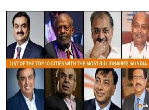
LIST OF THE TOP 10 CITIES WITH THE MOST BILLIONAIRES IN INDIA

ఉన్న ఆగ్రగ శ్రీమంతుల సంఖ్యను లెక్కి కట్టింది. 2031 నాటికి మనదేశంలో 313 మంది బిలియనీర్లు ఉంటారని పేర్కొంది. ఈ జాబితాలో ఒక్కో వ్యక్తి 100 కోట్లకు పైగా ఆస్తులను సంపాదించుకుంటారని ఆ సంస్థ ప్రకటించింది. 2026 లో 207 మంది బిలియనీర్లు మనదేశంలో ఉన్నారు. ఆ సంఖ్యతో పోల్చి చూస్తే 2031 నాటికి 51 శాతం శ్రీమంతులు పెరిగే అవకాశం ఉంది. చైనాలో 20%.. అమెరికాలో 12% శ్రీమంతుల సంఖ్య పెరిగే అవకాశం ఉందని ఆ సంస్థ వెల్లడించింది. ది వెల్ రిపోర్టులో ఆ సంస్థ ఈ నివేదికను వెల్లడించింది. ప్రపంచ వ్యాప్తంగా మారుతున్న వ్యాపారాలు.. ఇతర వ్యవహారాల వల్ల ప్రతిరోజు ప్రపంచంలో 89 మంది అల్ట్రా రిచ్ (30 మిలియన్ డాలర్ల సంపద) గా మారుతున్నట్లు తెలుస్తోంది. ప్రపంచ వ్యాప్తంగా మొత్తం 3,110 మంది బిలియనీర్లు ఉన్నారు. వచ్చే అదేళ్లలో ఈ సంఖ్య 3,915 కి పెరుగుతుందని సమాచారం. "ప్రపంచ వ్యాప్తంగా ప్రత్యేకమైన పరిస్థితులు ఉన్నప్పటికీ.. విభిన్నమైన వ్యాపారాలు చేసేవారు తమ సంపదను పెంచుకుంటున్నారు.