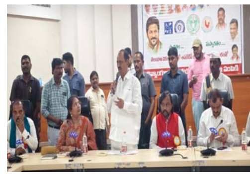
అందిస్తున్న అవకాశాలను వినియోగించుకుని అన్ని రంగాల్లో ముందుకు రావాలని దివ్యాంగులకు పిలుపునిచ్చారు. సహాయ అవకాశాలతో దివ్యాంగులు సమాజంలో ముందడుగు వేయడానికి ప్రభుత్వం కట్టుబడి ఉందని స్పష్టం చేశారు.