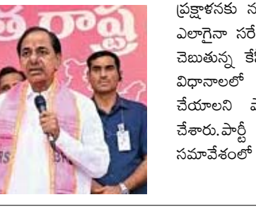
ప్రక్షాళనకు నడుం బిగించారు. వచ్చే ఎన్నికల్లో ఎలాగైనా సరే అధికారాన్ని దక్కించుకుంటామని చెబుతున్న కేసీఆర్.. దానికి అనుసరించాల్సిన విధానాలలో ఆయన ఇప్పటినుంచే అమలు చేయాలని పార్టీ కార్యకర్తలకు హిత బోధ చేశారు. పార్టీ కార్యాలయంలో ఏర్పాటు చేసిన సమావేశంలో - మిగతా5లో

హైదరాబాద్, ఏప్రిల్ 28: తీవల జగిత్యాలలో సభ నిర్వహించిన తర్వాత.. కొద్దిరోజులపాటు వ్యవసాయ క్షేత్రానికి పరిమితమైన భారత రాష్ట్ర సమితి అధ్యక్షుడు కేసీఆర్ బయటికి వచ్చారు. సోమవారం భారత రాష్ట్ర సమితి వ్యవస్థాపక దినాన్ని పురస్కరించుకొని ఆయన.. పార్టీ రాష్ట్ర కార్యాలయంలో విస్తృత సమావేశం నిర్వహించారు. ఈ సందర్భంగా కేసీఆర్ పార్టీ