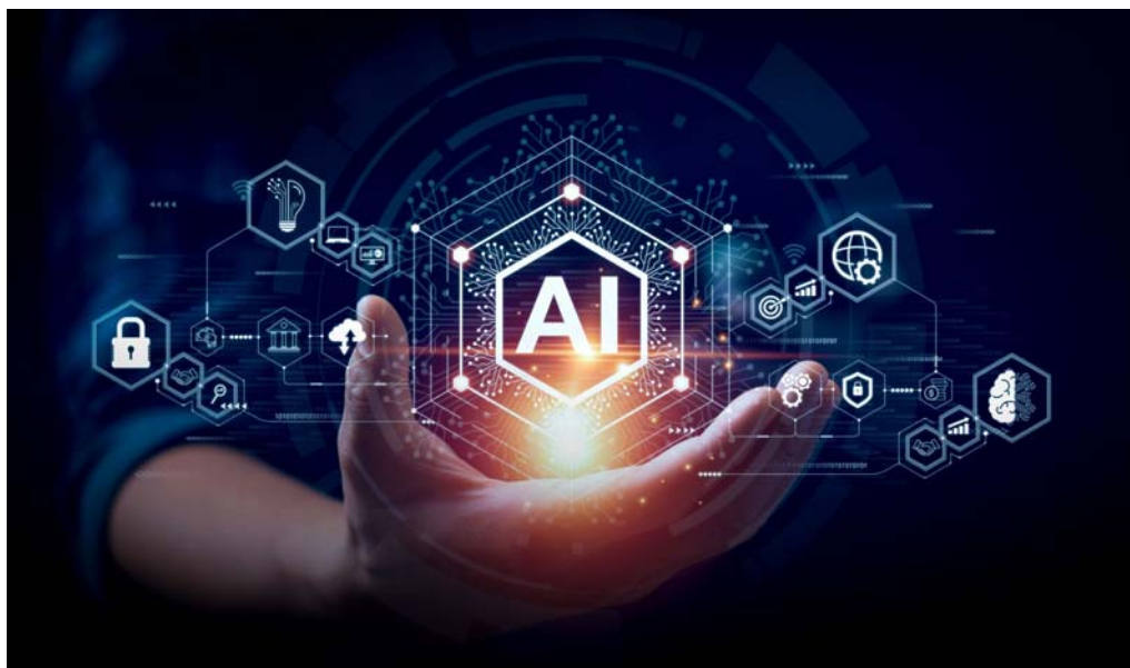
ఫ్లోవేషన్ మోడల్ టూల్స్ పై కూడా శిక్షణ ఇస్తోంది. సీఈఓ సలీల్ పరోట్ ప్రకారం.. ఐఐ సేవలలో సుమారు 300 బిలియన్ డాలర్ల మార్కెట్ అవకాశం ఉంది. ఇన్ఫోసిస్ తన సేవలను విస్తరించడమే కాకుండా, ఇప్పటికే ఉన్న సేవల్లో యుగ ప్రభావంతో సుమారు 300 మందిని నియమించుకుంది. దీనివల్ల కస్టమర్లు తమ వ్యాపారాన్ని మరింత విస్తరించుకునే అవకాశాలు పొందుతున్నారు.

ఆర్టిఫిషియల్ ఇంటెలిజెన్స్ పలువురు ప్రముఖులు స్పందిస్తూనే ఉన్నారు. తాజాగా ఇన్ఫోసిస్ సీఈఓ సలీల్ పరోట్ తన అభిప్రాయం వెల్లడించారు. కృత్రిమ మేధస్సు.. భారతదేశ ఐటీ రంగంలో చాలా పెద్ద మార్పులను తీసుకురానుంది. అయితే, ఈ మార్పులు ఉద్యోగులను తగ్గించవని, ప్రతిగా మరిన్ని అవకాశాలను సృష్టించాయని ఆయన స్పష్టం చేశారు. భారతీయ ఐటీ కంపెనీలు ఇప్పటివరకు.. ఎక్కువగా కొత్తగా కొనేటే నుంచి వచ్చిన యువతను పెద్ద సంఖ్యలో నియమించుకొని, అనుభవజ్ఞులను తక్కువగా ఉంచే పిరమిడ్ నిర్మాణాన్ని అనుసరించాయి. కానీ యుగ ప్రభావంతో ఈ నిర్మాణం "డైమెండ్" ఆకారంగా మారవచ్చని విశ్లేషకులు భావిస్తున్నారు. అంటే.. మధ్యస్థ, ఉన్నత వైపుకొద్దీ కలిగిన నిపుణుల అవసరం గణనీయంగా పెరిగే అవకాశం ఉంది. ఈ పరిణామం ఒక్కసారిగా జరిగేది కాదు. ఉదాహరణకు.. గత ఆర్థిక సంవత్సరంలో ఇన్ఫోసిస్ 20,000 మంది కొత్త గ్రాడ్యుయేట్లను నియమించగా, ఈ సంవత్సరం కూడా దాదాపు అదే స్థాయిలో నియామకాలు కొనసాగునున్నాయి. దీనినిబట్టి చూస్తే.. ఇన్ఫోసిస్ కంపెనీ ఇప్పటికే యుగ ఆధారిత భవిష్యత్తుకు తగిన విధంగా తన వ్యూహాలను మార్చుకుంటోందని తెలుస్తోంది. కొత్తగా చేరే ఉద్యోగులకు కంపెనీ సాధారణ సాఫ్ట్వేర్ డెవలప్ మెంట్ తో పాటు,