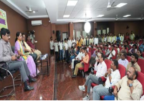
హైదరాబాద్, అక్షర సవార్: తెలంగాణ రక్షణ సేన (టీఆర్ఎస్) చీఫ్ కల్వకుంట్ల కవిత సంచలన వ్యాఖ్యలు చేశారు. బెన్ గ్రేట్ ప్రెస్ కలెక్టర్ డియూడబ్ల్యుజే ఆధ్వర్యంలో శనివారం నిర్వహించిన "మీట్ ది ప్రెస్" కార్యక్రమంలో పాల్గొన్న కవిత, జర్నలిస్టులు అడిగిన ప్రశ్నలకు సూటిగా సమాధానమిచ్చారు. "తెలంగాణలో విద్య, వైద్యం ప్రీగా ఇవ్వకుంటే రాజకీయ కొట్టండి. మా పాంచజన్యంలోని ఐదు

మీట్ ది ప్రెస్ లో టీఆర్ఎస్ చీఫ్ కల్వకుంట్ల కవిత... వెయ్యి రోజుల్లో కాంగ్రెస్ ప్రభుత్వాన్ని గద్దె దించుతాం... మా నాన్న కేసీఆర్ ను తిట్టలేదు.. టీఆర్ఎస్ అధ్యక్షుడిని విమర్శించా! పాంచజన్యం అమలు చేయకుంటే గన్ పార్క్ స్తంభానికి కట్టెని కొట్టండి.. మీట్ ది ప్రెస్... టీఆర్ఎస్ చీఫ్ కవిత సంచలన వ్యాఖ్యలు..