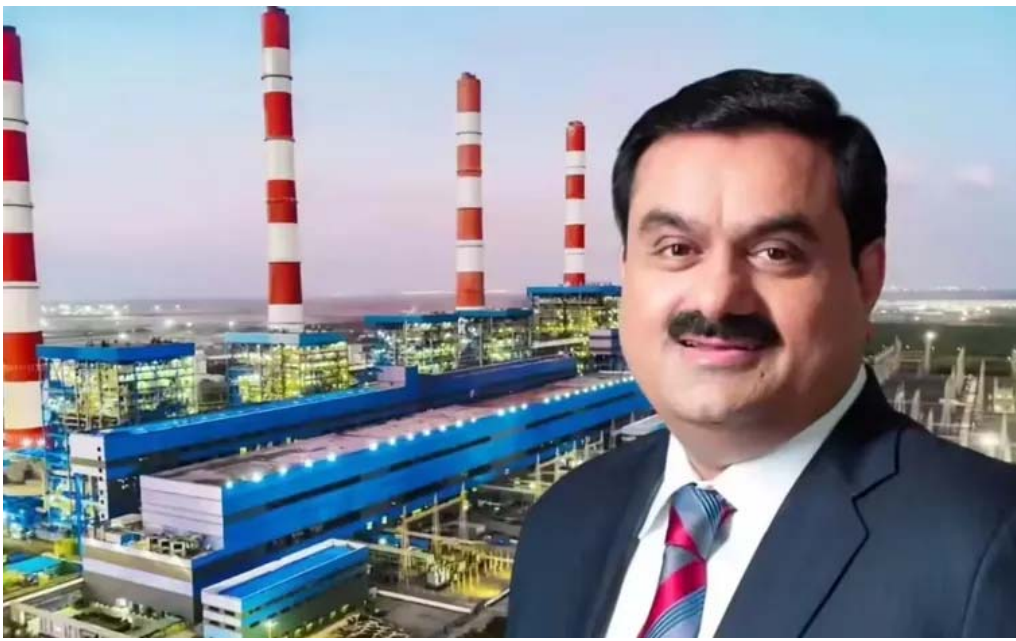
నుంచి 25 ఏకైకాలు 1,600 మెగావాట్ల విద్యుత్ సరఫరాకు ఎల్వోపను అందుకుంది.

న్యూఢిల్లీ: ప్రయివేట్ రంగ విద్యుత్ దిగ్గజం అదానీ పవర్ గత ఆర్థిక సంవత్సరం(2025--26) చివరి త్రైమాసికంలో ప్రోత్సాహకర ఫలితాలు సాధించింది. జనవరి--మార్చి(క్వార్టర్)లో కన్వాలిడేటెడ్ నికర లాభం 64 శాతం జంప్ చేసి రూ. 4,271 కోట్లను అధిగమించింది. ఆదాయంలో వృద్ధి, తగ్గిన పన్ను వ్యయాలు ఇందుకు దోహదపడ్డాయి. అంతర్జాతీయ ఏడాది(2024--25) ఇదే కాలంలో కేవలం రూ. 2,599 కోట్లు ఆర్జించింది. మొత్తం ఆదాయం సైతం రూ. 14,535 కోట్ల నుంచి రూ. 15,989 కోట్లకు ఎగసింది. మార్చిలో ముగిసిన పూర్తి ఏడాదికి రూ. 12,971 కోట్ల నికర లాభం ఆర్జించింది. 2024--25లో రూ. 12,750 కోట్ల లాభం అందుకుంది. 2026 మార్చి 31కల్లా మహాన్(1,600 మెగావాట్లు), రాయ్ పూర్ (1,600 మెగావాట్లు), రాయ్ గడ్(1,600 మెగావాట్లు) రెండో దశల పనులు 86--47 శాతం మధ్య పూర్తయినట్లు కంపెనీ వెల్లడించింది. సొంత అనుబంధ కంపెనీ కోలా పవర్ 1320 మెగావాట్ల రెండో దశ ఈ ఆర్థిక సంవత్సరం(2026--27)లో పూర్తికాగలదని పేర్కొంది. 2031--32కల్లా 23.7 గిగావాట్ల ధర్మల్ విద్యుత్ సామర్థ్యాన్ని సాధించాలని లక్ష్యంగా పెట్టుకుంది. గతేడాది క్వార్టర్ మహారాష్ట్ర విద్యుత్ బోర్డు నుంచి 25 ఏకైకాలు 1,600 మెగావాట్ల విద్యుత్ సరఫరాకు ఎల్వోపను అందుకుంది.