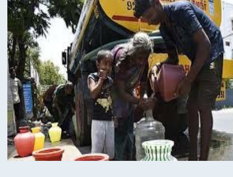
హైదరాబాద్, మే 5: భామిడి భగభగలకు నగరం విలవిలలాడుతోంది. పెరుగుతున్న ఉష్ణోగ్రతలకు తోడు తాగునీటి కొరత తోడవడంతో సామాన్యుల అవస్థలు వర్షనాటికే మారాయి. నగరానికి నీటిని అందించే ప్రధాన జలాశయాల్లో నిల్వలు వేగంగా పడిపోతుండడమే ఈ దుస్థితికి ప్రధాన కారణం. నగర దాహార్తిని తీర్చే నాగార్జునసాగర్, ఎల్లంపల్లి వంటి జలాశయాల్లో నీటి నిల్వలు ఆందోళనకర స్థాయికి చేరుకున్నాయి. నాగార్జునసాగర్లో పూర్తి స్థాయి సామర్థ్యం 312 టీఎంసీలు కాగా, ప్రస్తుతం కేవలం 160 టీఎంసీలు మాత్రమే అందుబాటులో ఉన్నాయి. ఎల్లంపల్లిలో ఇక్కడ పరిస్థితి మరింత దారుణంగా ఉంది. 20 టీఎంసీల సామర్థ్యానికి గాను నిల్వలు 9 టీఎంసీలకు పడిపోయాయి. మే నెలలో ఈ మట్టాలు మరిన్ని కనిష్ట స్థాయికి పడిపోయే ప్రమాదం ఉండటంతో జలమండలి అత్యవసర పంపింగ్ చర్యలకు సిద్ధమవుతోంది. సాధారణంగా రోజు విడిచి రోజు రావాల్సిన నీరు, ఇప్పుడు మూడు నాలుగు రోజులకోసారి సరఫరా అవుతోందని పలు ప్రాంతాల ప్రజలు వాపోతున్నారు. సరఫరా అయ్యే కొద్ది సమయం కూడా నీటి ఒత్తిడి (ప్రెజర్) తక్కువగా ఉండటంతో బిందెలు నిండటానికి గంటల కొద్దీ వేచి చూడాలి వస్తోంది. సీతాఫలమండి, డిబీఆర్ లేన్ వంటి ప్రాంతాల్లో ప్రజలు నిద్ర మానుకొని అర్ధరాత్రి వేళ నీటి కోసం ఏడుల్లో ఎదురుచూడాలి వంటి పరిస్థితి నెలకొంది. ఒకవైపు నీటి కొరత వేధిస్తుంటే, మరోవైపు పాతబస్టి, ఖైరతాబాద్, అమీర్ పేట వంటి ప్రాంతాల్లో పైపులైన్ లీకేజీల కారణంగా మురుగు నీరు కలిసి వస్తోందని స్థానికులు ఆందోళన వ్యక్తం చేస్తున్నారు. నల్ల వదిలిన మొదటి 15-20 నిమిషాల పాటు కలుషిత నీరు వస్తుండటంతో, వాటిని వదిలేయడం వల్ల భారీగా నీరు వృధా అవుతోంది. నల్ల నీరు సక్రమంగా అందకపోవడంతో ప్రజలు ప్రైవేటు ట్యాంకర్లపై ఆధారపడుతున్నారు. దీనివల్ల ఖర్చులు పెరగడమే కాకుండా, ట్యాంకర్ల కోసం కూడా రోజుల తరబడి వేచి ఉండాలి వస్తోంది. నగరవ్యాప్తంగా సుమారు 14.43 లక్షల కనీష్ట ద్వారా ప్రతిరోజూ 2,647 మిలియన్ లీటర్ల నీటిని సరఫరా చేస్తున్నట్లు గణాంకాలు చెబుతున్నా, క్షేత్రస్థాయిలో మాత్రం జనం దాహార్తి తీరడం లేదు. ఖైరతాబాద్, బేగంపేట, ముమ్సాబాద్, చందానగర్, కూకట్ పల్లి సహా దాదాపు అన్ని ప్రధాన ప్రాంతాల్లో నీటి కష్టాలు తీవ్ర రూపం దాల్చాయి. అధికారులు యుద్ధ ప్రాతిపదికన స్పందించి ప్రభుత్వం ద్వారా ఏర్పాటు చేయాలని నగరవాసులు కోరుతున్నారు.