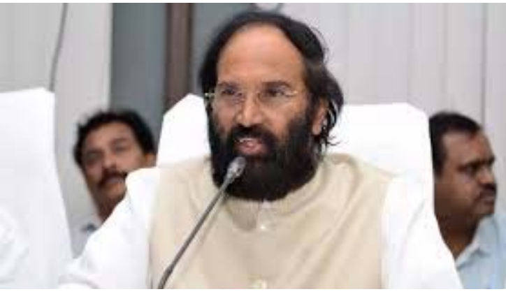
కేసీఆర్ దర్శాపు ముమ్మరంగా కొనసాగుతోంది. 16 బృందాలుగా గాలింపు రాష్ట్ర సరిహద్దులు దాటి అన్వేషణ: నిందితులను పట్టుకునేందుకు పోలీసులు 16 బృందాలుగా విభజించి, దాదాపు -- మిగతా5లో

హైదరాబాద్: తెలంగాణలోని పలు జిల్లాల్లో కురుస్తున్న ఆకాల వర్షాలు మరియు భారీ వేసవి జల్లుల నేపథ్యంలో, రైతులు నష్టపోకుండా ఉండేందుకు రాష్ట్ర నీటిపారుదల మరియు పౌరసరఫరాల శాఖ మంత్రి ఎన్.ఉత్తమ్ కుమార్ రెడ్డి అధికారులను ఆదేశించి చేశారు. అత్యవసర సమీక్ష సమావేశంలో, ధాన్యం సేకరణ ప్రక్రియను వెంటనే వేగవంతం చేయాలని ఆయన ఆదేశించారు. ఒకవైపు ధాన్యం రాక పెరగడం, మరోవైపు ఈ వారం అంతా వర్షాలు కురిసే అవకాశం ఉందన్న వాతావరణ శాఖ హెచ్చరికల నేపథ్యంలో ప్రభుత్వం యంత్రాంగం పై అలర్ట్లో ఉంది. ప్రస్తుత రబీ మార్కెటింగ్ సీజన్లో ఇప్పటివరకు రాష్ట్రవ్యాప్తంగా 14.80 లక్ష మెట్రిక్ టన్నుల ధాన్యాన్ని సేకరించినట్లు ప్రభుత్వం వెల్లడించింది. రాష్ట్రంలోని మొత్తం 8,575 కొనుగోలు కేంద్రాలు పూర్తిస్థాయిలో పనిచేస్తున్నాయని, ఇప్పటివరకు 1.84 లక్షల మంది రైతుల నుండి ధాన్యం కొనుగోలు చేసినట్లు మంత్రి తెలిపారు. రైతులకు చెల్లింపుల విషయంలో కూడా ప్రభుత్వం వేగంగా వ్యవహరిస్తోంది, ఇప్పటికే రూ. 2,001.96 కోట్లను నేరుగా రైతుల ఖాతాల్లో జమ చేసింది. గత రాత్రి -- మిగతా5లో