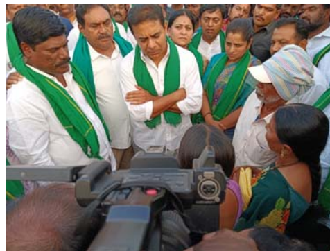
ప్రభుత్వానికి అదే లాభమని భావిస్తున్నారని రైతులు ఫిర్యాదు చేశారు. అలాంటి పరిస్థితి రాకుండా అధికారులతో మాట్లాడి కొనుగోలు చేసిన మొక్కజొన్న బిల్లులను వెంటనే తరలించేలా చర్యలు తీసుకుంటామని కేసీఆర్ తెలిపారు. రైతులకు అండగా నిలిచేందుకు వరంగల్లో రైతు సంగ్రామ నడచు నిర్వహిస్తున్నామని చెప్పారు.