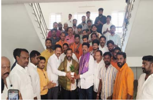
కార్యకర్తలు తదితరులు పాల్గొన్నారు.