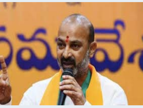
కలీంసగర్: కేంద్రమంత్రి బండి సంజయ్ కుమార్ మాట్లాడుతూ వడ్ల కొనుగోలు కోసం పడిగావులు కాస్తున్నామని వాపోయిన రైతులకు, తరుగు పేరుతో బస్తాకు నాలుగైదు కేజీలు దోచుకుంటున్నారని వాపోయిన రైతులు. అనంతరం మీడియాతో కేంద్ర మంత్రి ఏమన్నారంటే: ఇంకెంతమందిని బలి కొంటారు రైతులు చస్తున్నా వడ్లను కొనుగోలు చేయరా, కొనుగోలు కేంద్రాలవద్ద అరిగోస పడుతున్నా స్పందించరా ప్రతి గింజుకు కేంద్రమే పైసలిస్తుంటే కొనడానికి మీకున్న ఇబ్బందేమిటి? వడ్ల కొస్తుండుకు రాష్ట్ర ప్రభుత్వానికి కమిషన్ కూడా ఇస్తున్నాం కదా వడ్ల కొనుగోలు కేంద్రాలకు వెళ్లితే మంత్రులను రైతులు కొట్టేటట్లు ఉన్నారు. రైతులను నట్టేట మంచారా? వేతికి పంట వచ్చేదాకా ఒక టెన్షన్ చేతికొచ్చాకా అమ్ముకోవడానికి పడిగావులు కావాలా? 90 లక్షల మెట్రిక్ టన్నుల వడ్ల వస్తే ఇప్పటిదాకా 15 లక్షల మెట్రిక్ టన్నులే కొంటారు కొనుగోలు కేంద్రాలవద్ద టోకెన్లు ఇవ్వడానికి కూడా కమిషన్లు దండుకుంటున్న దుర్మార్గులు. తాలు, తరుగు, తేమ పేరుతో అడ్డగోలుగా దోచుకుంటున్నారు రైతుల కష్టాన్ని దశారులు దోచుకుంటున్నా స్పందించరా? వాస్తవాలు మాట్లాడితే మాపై ఎదురు దాడి చేస్తారా కాంగ్రెస్ ప్రభుత్వం అన్ని వర్గాలను మోసం చేస్తోంది ఫీజు రీయంబర్స్ మెంట్ కూడా ఇయ్యలేక ఎస్సీ, ఎస్టీ, బీసీ, ఈబీసీ వర్గాల విద్యార్థుల భవిష్యత్తును దెబ్బతీస్తారా? కేంద్రం ఎస్టీ విద్యార్థుల రీయంబర్స్ మెంట్ కోసం నిధులు మంజూరు చేసినా వాడుకోలేని అసమర్థ ప్రభుత్వం కాంగ్రెస్ ది..