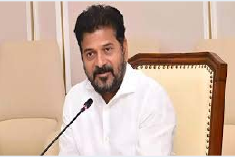
కేసీఆర్ దర్శాపు ముమ్మరంగా కొనసాగుతోంది. 16 బృందాలుగా గాలింపు రాష్ట్ర సరిహద్దులు దాటి అన్వేషణ: నిందితులను పట్టుకునేందుకు పోలీసులు 16 బృందాలుగా విభజించి, దాదాపు -- మిగతా5లో

హైదరాబాద్: కరీంనగర్లో జరిగిన సంవలన గన్పాయింట్ దోపిడీ కేసు రాష్ట్రవ్యాప్తంగా తీవ్ర చర్చనీయాంశంగా మారింది. కరీంనగర్ జిల్లాలోని పీఎంజే జ్యువెలరీ షిఫ్ట్లో జరిగిన ఈ ఘటనలో రెండు కోట్ల ప్రావర్తి దొంగతనం జరగగా, 50 గంటలు గడిచినా నిందితుల ఆచూకీ లభించకపోవడంతో ప్రభుత్వం అప్రమత్తమైంది. ఈ కేసును అత్యంత సీరియస్గా తీసుకున్న ముఖ్యమంత్రి రేవంత్ రెడ్డి, వెంటనే కేసును ఛేదించి నిందితులను అరెస్ట్ చేయాలని పోలీసు ఉన్నతాధికారులకు స్పష్టమైన ఆదేశాలు జారీ చేసినట్లు సమాచారం. దర్శాపులో ఎలాంటి నిర్లక్ష్యం సహించబోమని కూడా హెచ్చరించినట్లు తెలుస్తోంది. "సంబుధార్" కూ తో కొత్త మలుపు. ఘటనా స్థలంలో దుండగులు వదిలేసిన బ్యాగుపై "బిఎల్ నందుర్వార్" అని రాసి ఉండటం కేసులో కీలక కట్టాగా మారింది. దీంతో మహారాష్ట్రలోని నందుర్వార్ ప్రాంతంతో సంబంధం ఉండొచ్చని పోలీసులు అనుమానిస్తున్నారు. ఈ