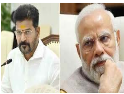
ప్రధానమంత్రి సరేంద్రమోడీ నిన్న(ఆదివారం) హైదరాబాద్ లో అభివృద్ధి పనులను ప్రారంభించారు. హైదరాబాద్ లో జరిగిన ప్రభుత్వ