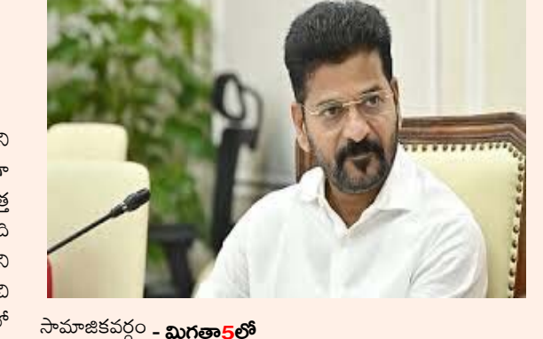
సామాజికవర్గం - మిగతా5లో

జూరాల ప్రాజెక్టులో పూడిక తొలగించి నిల్వ సామర్థ్యం పెంచుతున్నట్లు తెలిపారు. ఐశా కింద జూరాల అభివృద్ధికి ప్రతిపాదనలు చేశామని వివరించారు. వర్షాకాలానికి ముందే చెరువుల్లో పూడికతీత పనులు చేపడతామని స్పష్టం చేశారు. పాలమూరు-రంగారెడ్డి ప్రాజెక్టు పూర్తి చేస్తామని స్పష్టం చేశారు. 12.30 లక్షల ఎకరాలకు సాగునీరు అందించడమే లక్ష్యమని పేర్కొన్నారు. 1226 గ్రామాలకు తాగునీరు అందిస్తామని తెలిపారు. 15 రోజుల్లో మరోసారి ప్రగతి సమీక్ష నిర్వహిస్తామని చెప్పుకొచ్చారు. ఆయా ప్రాజెక్టుల పురోగతిపై సమగ్ర నివేదికలు ఇవ్వాలని అధికారులను మంత్రి ఉత్తమ్ కుమార్ రెడ్డి ఆదేశించారు.