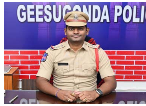
నిర్ణయించి, రూ.1 లక్ష అడ్వాన్స్ గా చెల్లించినట్లు తెలిపారు. అనంతరం 25న మధ్యాహ్నం గ్రామ పెద్దలతో కలిసి స్థలం కొలతలు వేసి కొనుగోలుదారులకు అప్పగించే సమయంలో