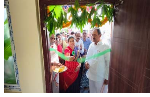
ఇంటిగ్రేటెడ్ స్కూల్స్ ఏర్పాటు వంటి కార్యక్రమాలు అమలు చేస్తున్నట్లు వివరించారు. మహిళల సాధికారతే లక్ష్యంగా ప్రభుత్వం నిరంతరం కృషి చేస్తోందని ఎమ్మెల్యే స్పష్టం చేశారు. పిల్లలకు పోషకాహారం, ప్రాథమిక విద్య, ఆరోగ్య