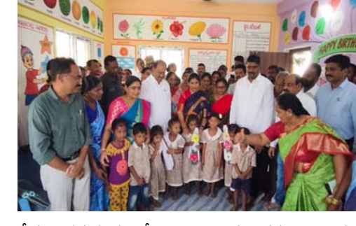
సేవలు సమస్యయంతో అందించాల్సిన అవసరాన్ని ఆయన హైలైట్ చేశారు. విద్య, వైద్య రంగాలకు కాంగ్రెస్ ప్రభుత్వం అత్యధిక ప్రాధాన్యత ఇస్తోందని ఆయన తెలిపారు.