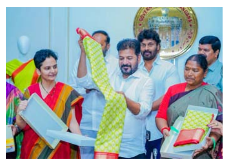
భాగంగా రాష్ట్రవ్యాప్తంగా స్వయం సహాయక సంఘాల

హైదరాబాద్: రాష్ట్రంలోని స్వయం సహాయక సంఘాల మహిళలను ఆర్థికంగా బలోపేతం చేసి కోటీశ్వరులను చేయాలన్న లక్ష్యంతో రాష్ట్ర ప్రభుత్వం కీలక నిర్ణయాలు తీసుకుంటోంది. తెలంగాణ ముఖ్యమంత్రి రేవంత్ రెడ్డి ప్రకటించారు. మహిళలు ఆర్థికంగా స్వయం సమృద్ధి సాధించేందుకు రాష్ట్రవ్యాప్తంగా మహిళా సంఘాలకు భారీ స్థాయిలో వ్యాపార అవకాశాల కల్పించేందుకు ప్రభుత్వం సమగ్ర కార్యాచరణతో ముందుకు సాగుతోందని స్పష్టం చేశారు. ప్రజాపాలన-ప్రగతి ప్రణాళిక లో