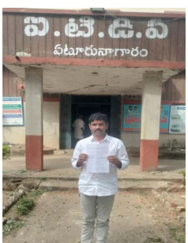
వికీటిగా అమలు చేయాలని వారు విజ్ఞప్తి చేస్తున్నారు.

వివక్ష చూపుతున్నారనే ఆరోపణలు వినిపిస్తున్నాయి. డిప్యూటీషన్ పై ఉన్న ఉపాధ్యాయులు గిరిజన ఆక్రమ పాఠశాలల్లో పని చేస్తున్నా, వారి సొంత పాఠశాలల్లో ఖాళీలు పెరిగి విద్యార్థులకు బోధనలో ఇబ్బందులు ఏర్పడుతున్నాయని పలువురు ఉపాధ్యాయులు వాపోతున్నారు. కమిషనర్ కార్యాలయం జారీ చేసిన ఉత్తర్వులను అమలు చేయడంలో జాప్యం చేయడం వల్ల పరిపాలనాచరమైన అసృష్టత నెలకొందని, ఇది గిరిజన విద్యార్థుల విద్యాభ్యాసంపై ప్రభావం చూపే అవకాశం ఉందని ఉపాధ్యాయ సంఘాల