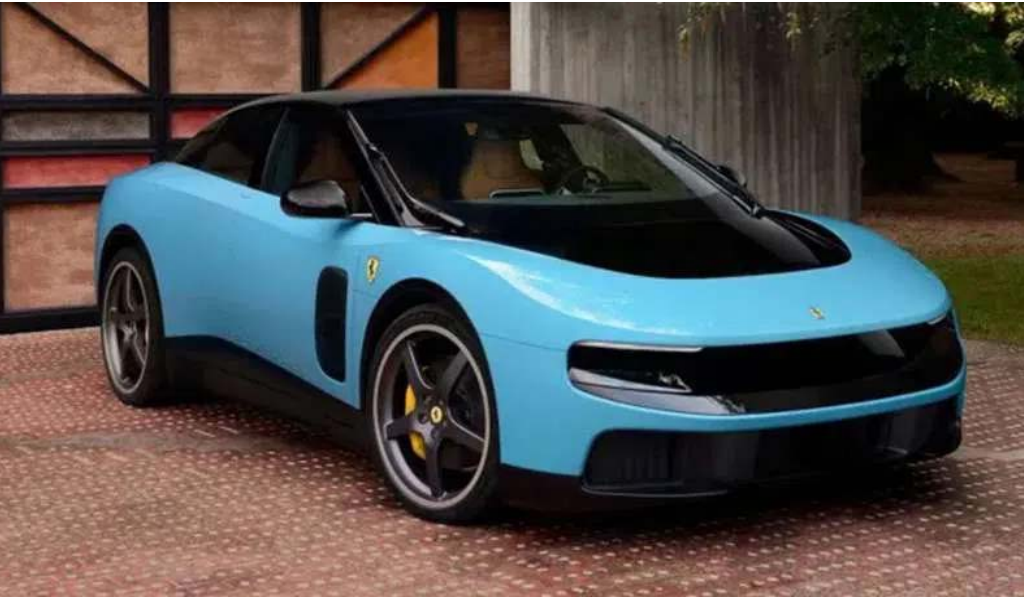
సంబంధించిన ఆన్ని పరికరాలను ఇన్హాజ్లోనే తయారీ చేసినట్లు చెప్పారు.

న్యూఢిల్లీ: లగ్జరీ కార్ల తయారీ కంపెనీ ఫెరారీ కొత్తగా పూర్తి స్థాయి ఎలక్ట్రిక్ కారును ఆవిష్కరించింది. లూస్ అనే ఆ కారు ఖరీదు సుమారు ఆరున్నర లక్షల డాలర్లు. ఇటలీ బ్రాండ్ ఫెరారీ కంపెనీ తొలిసారి ఫైవ్ సీటర్ వాహనాన్ని తయారు చేసింది. లవ్ప్రెమ్ ఏజెన్సీ సహకారంతో దీన్ని డిజైన్ చేశారు. సోఫట్ మీడియాలో కొత్త ఎలక్ట్రిక్ ఫెరారీ కారుపై ప్రశంసలు కురుస్తున్నాయి. మాస్టర్కాన్ డిజైన్లో ఉన్నట్లు కొందరు పేర్కొన్నారు. అయితే ఎలక్ట్రిక్ కార్ల వ్యాపారంలో ప్రస్తుతం డిమాండ్ తక్కువగా ఉంది. దీంతో సూపర్ కార్లు తయారు చేసే లాంఛోర్ని, పోర్చే కంపెనీలు ప్రస్తుతం ఈవి కార్లను అనుకున్నంత ఉత్సాహి చేయడం లేదు. చైనా బ్రాండ్ల నుంచి తీవ్రమైన పోటీ ఉన్న నేపథ్యంలోనూ లగ్జరీ కంపెనీలు ఈవి కార్లను లాంచ్ చేయలేకపోతున్నాయి. లూస్ అంటే ఇటలీ భాషలో కాంతి అని, ఈ కారును డెవలప్ చేసేందుకు అయిదేళ్లు పట్టిందని ఫెరారీ సీఈవో బెనెడెట్టో విగ్నా తెలిపారు. లూస్ ఎలక్ట్రిక్ కారు వీల్స్కు ఎలక్ట్రిక్ మోటార్లు ఉన్నాయని, కేవలం 2.5 సెకన్లలో ఆ కారు 96 కిలోమీటర్ల వేగాన్ని అందుకుంటుందని ఫెరారీ నిపుణులు చెబుతున్నారు. కారుకు