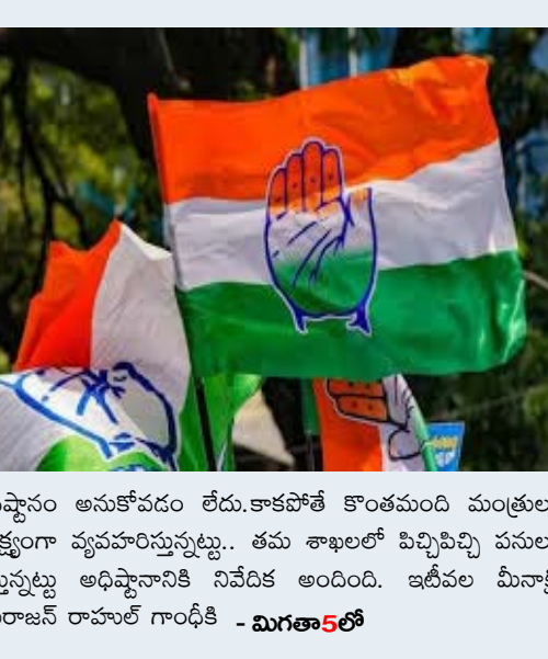
అధిష్టానం అనుకోవడం లేదు. కాకపోతే కొంతమంది మంత్రులు నిర్లక్ష్యంగా వ్యవహరిస్తున్నట్లు.. తమ శాఖలలో పిచ్చిపిచ్చి పనులు చేస్తున్నట్లు అధిష్టానానికి నివేదిక అందింది. ఇటీవల మీనాక్షి నటరాజన్ రాహుల్ గాంధీకి - మిగతా5లో

హైదరాబాద్, మే 30: కాంగ్రెస్ పార్టీ ఇటీవల జరిగిన ఎన్నికలలో కేవలం కేరళ రాష్ట్రంలో మాత్రమే అధికారంలోకి వచ్చింది. తమిళనాడు రాష్ట్రంలో అధికార పక్షంలో ఒక భాగమైంది. కీలకమైన పత్రికలు బెంగాల్లో.. అస్సాంలో.. చిన్న రాష్ట్రమైన పుదుచ్చేరిలో అధికారాన్ని దక్కించుకోలేకపోయింది. కనీసం చెప్పుకునే స్థాయిలో శాసనసభ స్థానాలను దక్కించుకోలేకపోయింది. క్షేత్రస్థాయిలో పరిస్థితి ఇలా ఉన్నప్పటికీ కాంగ్రెస్ పార్టీ కార్యాలయం ఇప్పుడు వచ్చే వాళ్ళతో.. పోయే వాళ్ళతో అత్యంత రద్దీగా ఉంది. రాహుల్ గాంధీ కూడా మల్లికార్జున కాట్.. వేణుగోపాల్ రెడ్డి వంటి వారితో నిత్యం సమావేశాలు పెడుతున్నారు. ఏం జరిగి ఉంటుంది.. ఏం జరుగుతోంది అనే ప్రశ్నలు వ్యక్తమవుతున్నప్పటి.. తెలంగాణ నేతలు అక్కడ కనిపిస్తున్నారు. కొద్దిరోజుల వరకు సాగిన కర్ణాటక పంచాయితీ డిక్షి శివకుమార్ ముఖ్యమంత్రి కావడంతో ముగిసింది. ఇప్పుడు మళ్ళీ తెలంగాణ పంచాయితీ ప్రారంభమైంది. అలాగే తెలంగాణలో ముఖ్యమంత్రి మార్పు జరగడం లేదు. రేవంట్ రెడ్డి స్థానంలో కొత్త వ్యక్తిని ముఖ్యమంత్రిగా చేయాలని కాంగ్రెస్ పార్టీ